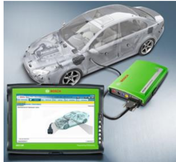
Należy skorzystać z testera usterek, np. Bosch KTS