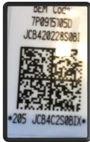
Nalepka z kodem na pokrywie akumulatora