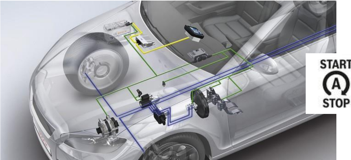
Komponenty systemu Start/Stop

W pojazdach z systemem Start/Stop w trakcie postoju np. na światłach silnik jest wyłączany. Wówczas zadanie zasilania wyposażenia elektrycznego spada na akumulator. Dodatkowo, zwiększa się liczba uruchomień silnika, czyli dużych obciążeń akumulatora.