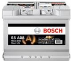
Akumulatory do Start/Stop – EFB lub AGM